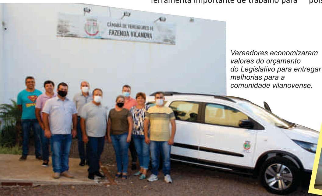
Vereadores economizaram valores do orçamento do Legislativo para entregar melhorias para a comunidade vilanovense.

Os vereadores indicaram ao Executivo que o valor seja utilizado na reforma do atual Prédio da Brigada Militar e no programa de reforma de casas de famílias em situação de vulnerabilidade social. Com este repasse de valores o Executivo poderá aumentar o número de famílias a serem beneficiadas com as reformas das casas, pois a demanda é grande e há poucos recursos. Ainda será possível melhorar as condições de trabalho da Brigada Militar em Fazenda Vilanova, pois o prédio está em péssimas condições.